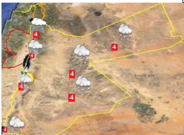
الحالة الجوية المتوقعة وخارطة التحذيرات لهذا اليوم

درجة الحرارة الصغرى الليلة القادمة في العقبة ١١°س